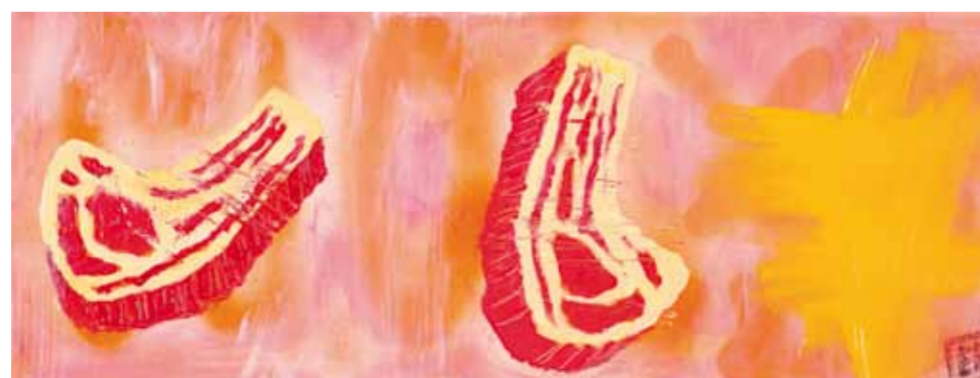
The Three Graces Reloaded, 2013 3 x 90 cm