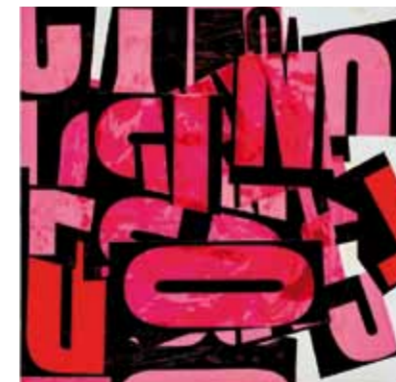
The Dizzy Hare, 2015 90 x 90 cm

Like the ATOMIC HARES, the series HOLY MEAT, HEROES RELOADED, and JAPAN TRESPASSED contain images magically brought to life. In our digital age of the binary code, these comic-book heroes, ghosts, and holy slices of meat lead us into a magical age where culture and nature are (still or possibly again?) interluded.