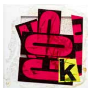
The K-Kreative Hare, 2015 50 x 50 cm

Die Serie HOLY MEAT zeigt scheinbar eigenmächtig in der Luft schwebende Ray Guns - eine Referenz an Claes Oldenburg, die als animierte rohe Steaks die Welt mit Strahlen durchdringen. Animismus östlicher Färbung zieht sich durch die mehrfach bearbeiteten Fotos der Serie JAPAN TRESPASSED. Sie zeigen eine - auch bildtechnisch - immer wieder vollzogene Annäherung an eine fremde Kultur. Wesen und Energiefelder, die an animistische Züge des Shintoismus denken lassen, beseelen die Bilder und markieren das Überschreiten des Bandes zwischen zwei Geisteswelten und Kulturen. The series HOLY MEAT features apparently free-floating ray guns - a reference to Claes Oldenburg - which in the form of animated raw steaks permeate the world with invisible rays. Animism with a Far-Eastern colouring pervades the multiply reworked photos in the series JAPAN TRESPASSED. They reflect a continual approximation of a foreign culture from a visual and technical standpoint. The Japanese-inspired pictures are populated with curious beings with visible energy fields, evocative of the animistic elements of Shintoism and marking the transgression of the line between two spirit worlds and cultures.