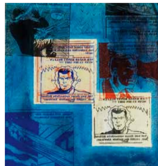
Radar Reloaded, 2013 60 x 55 cm