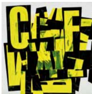
Manhattan Calling, 2015 50 x 50 cm