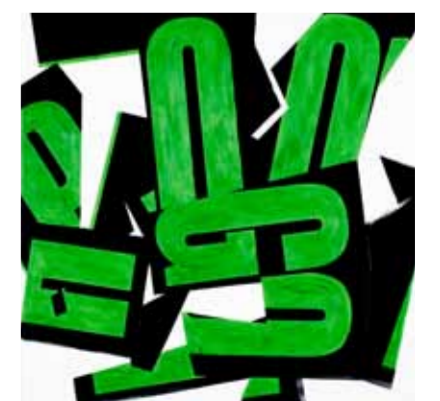
The Big Green Hare, 2015 90 x 90 cm