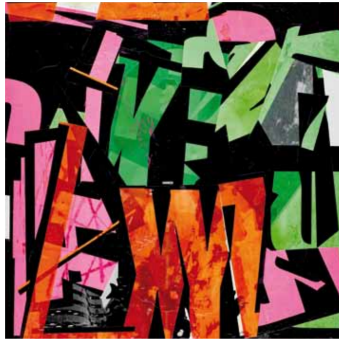
Tokyo Calling, 2015 50 x 50 cm

Posters atomized into letters of the alphabet - torn from their original context - give rise to a newly constructed reality. Text becomes image, the referential nature of language gives way to the purely visual character of neon-coloured poster type. Opacity and translucency, the sterility of mechanically printed surfaces, and painterly, human 'imperfections' all combine to create an aesthetic tension condensed into square form. And yet, many of the pictures contain hidden glimpses of a horizon, an allusion to a distant reality, albeit one of an atomic nature: the ATOMIC HARE. These creations are magical beings. They belong to a preterite culture or a world of the future, blending nature with culture, image with font. As in so many of Bachinger's works, everything seems to result from a spontaneous and unforced gesture, but, on closer inspection, is in fact the product of a long and considered process, from the choice of type to the non-hierarchical arrangement of the letters within each quadratic frame. Underlying the picture's prevailing upbeat mood is a hidden critical dimension.