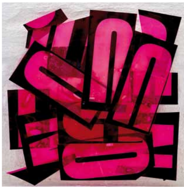
The Bananarama Hare, 2015 50 x 50 cm