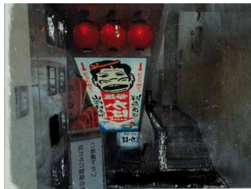
Your Choice, 2013 30 x 40 cm