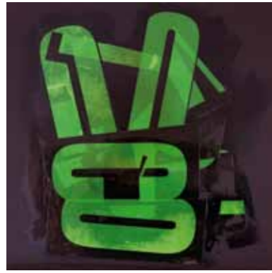
The Vegetarian Hare, 2015 50 x 50 cm