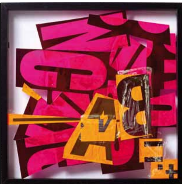
The Invisible Hare, 2015 50 x 50 cm

Superhelden, Comicfiguren und Ray Guns beleben die Bildwelt Bachingers. Inhaltlich wie formal wird auf Pop-Art, Abstrakten Expressionismus, Foto-realismus oder Happening zurückgegriffen. Die Retro-Optik aus der Zeit des Wirtschaftsaufschwungs, des Glaubens an den amerikanischen Traum und der faszinierenden Bildwelt der Werbung wird dann vielfach collagiert, bearbeitet, dekonstruiert.