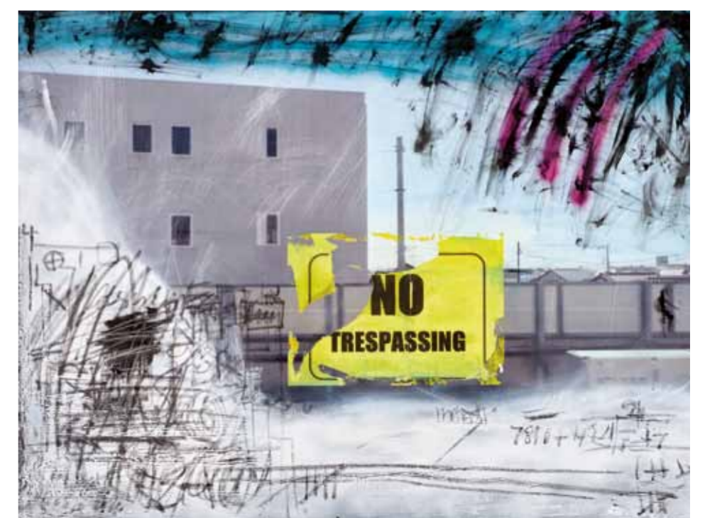
No Trespassing, 2012/2015 90 x 130 cm

Die Serie HOLY MEAT zeigt scheinbar eigenmächtig in der Luft schwebende Ray Guns - eine Referenz an Claes Oldenburg, die als animierte rohe Steaks die Welt mit Strahlen durchdringen. Animismus östlicher Färbung zieht sich durch die mehrfach bearbeiteten Fotos der Serie JAPAN TRESPASSED. Sie zeigen eine - auch bildtechnisch - immer wieder vollzogene Annäherung an eine fremde Kultur. Wesen und Energiefelder, die an animistische Züge des Shintoismus denken lassen, beseelen die Bilder und markieren das Überschreiten des Bandes zwischen zwei Geisteswelten und Kulturen. The series HOLY MEAT features apparently free-floating ray guns - a reference to Claes Oldenburg - which in the form of animated raw steaks permeate the world with invisible rays. Animism with a Far-Eastern colouring pervades the multiply reworked photos in the series JAPAN TRESPASSED. They reflect a continual approximation of a foreign culture from a visual and technical standpoint. The Japanese-inspired pictures are populated with curious beings with visible energy fields, evocative of the animistic elements of Shintoism and marking the transgression of the line between two spirit worlds and cultures.