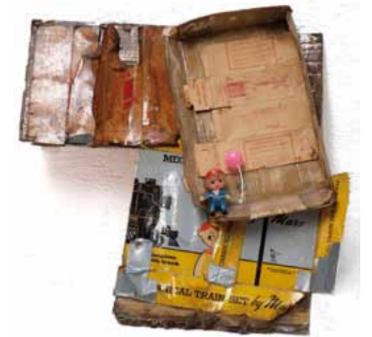
Just Move Along, 2013 (Little Boy And Mechanical Train) 60 x 60 x 10 cm