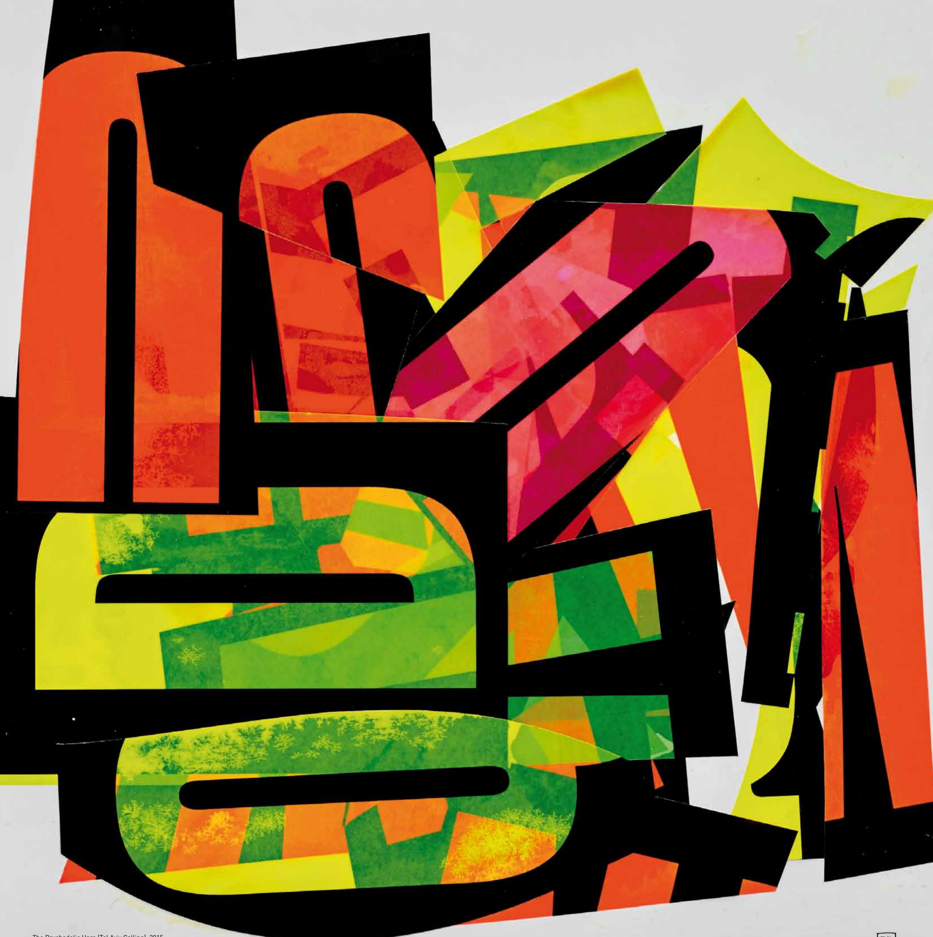
The Psychedelic Hare (Tel Aviv Calling), 2015 50 x 50 cm