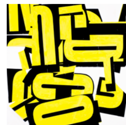
The Big Yellow Hare, 2015 90 x 90 cm

Ernst Bachinger hat Kunst im Kopf - schon seit der Schulzeit. Seine Schulhefte füllte er mit Raumschiffen, Flugzeugen und Comicfiguren. In der Münchner Gymnasialzeit prägten Bachinger Teilnahmen an Happenings an der Kunstakademie, Studium und Beruf verlagerten die Kreativität in einen anderen Sektor: den der Werbung. Seit 2003 widmet sich Ernst Bachinger wieder stärker der Kunst - mit den Mechanismen der Werbebranche im Hinterkopf. Pop-Art und Abstrakter Expressionismus sind der kunsthistorische Hintergrund der aktualisierten und postmodern ironisch verfremdeten Arbeiten in Auseinandersetzung mit dem goldenen Zeitalter des amerikanischen Traums und damit einhergehend - der Werbung. Auf den ersten Blick farbenprächtig, schnell zu erfassen und den Betrachter mit einer Ästhetisierung betörend, offenbaren die Arbeiten Bachingers eine weitere, tiefere Lage. Das, was leicht wirkt, ist in einem langen Prozess des Ausprobierens von Techniken und des Findens einer inneren Stimmigkeit konstruiert.