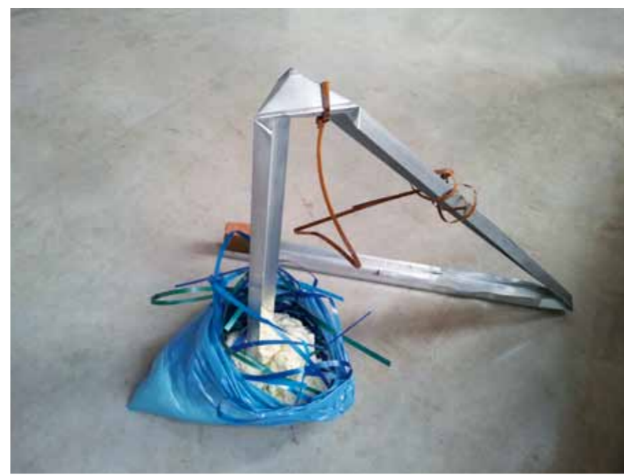
Mein armer kleiner Adam, 2012 150 x 70 x 100 cm